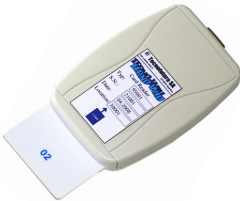
TECNO-WZU CARD READER

Das neue einfache TECNO-WZU-System für die Waschküche mit berührungslosen Karten Le nouveau simple système TECNO-WZU pour buanderies avec cartes sans contact Il nuovo semplice sistema TECNO-WZU per lavanderie con carte senza contatto