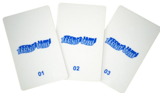
TECNO-WZU USER CARD